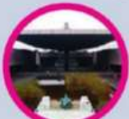
Museo Nacional de Antropología