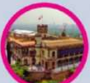
Castillo de Chapultepec

SABÍAS QUE... En 2016 The New York Times nombró a la CDMX "Destino Turístico #1" por los eventos internacionales realizados ese año, como el concierto de Roger Waters en el Zócalo.